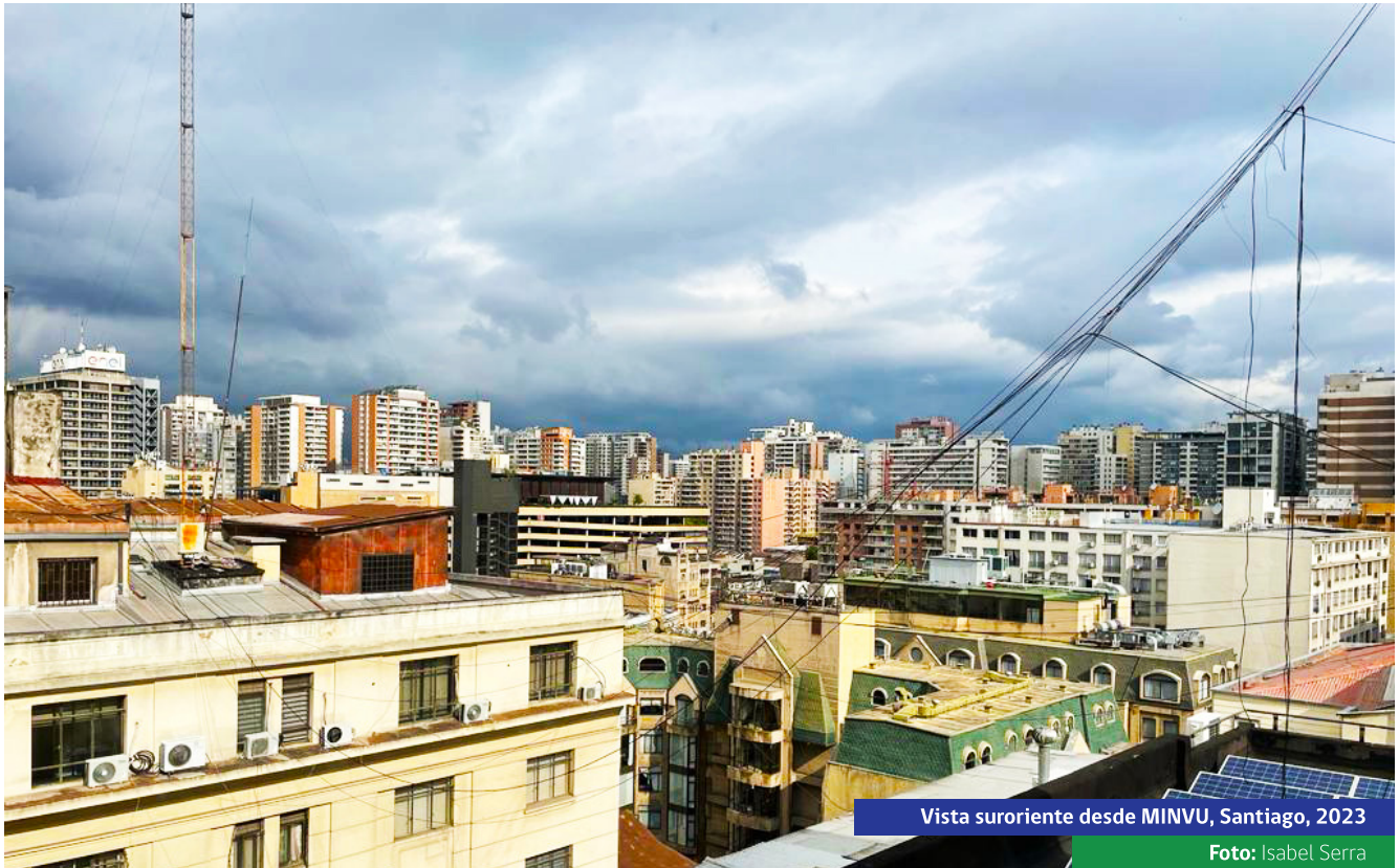
Vista suroriente desde MINVU, Santiago, 2023