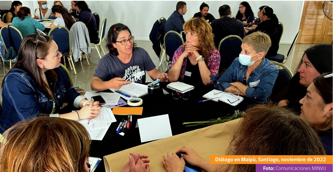
Diálogo en Maipú, Santiago, noviembre de 2022